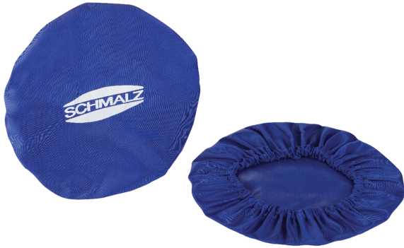
Fundas protectoras PC